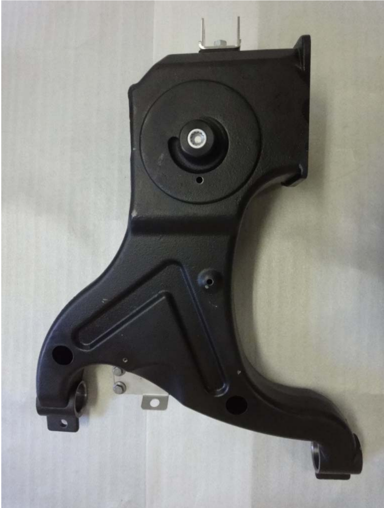
Foto des Teils / Photograph of the part