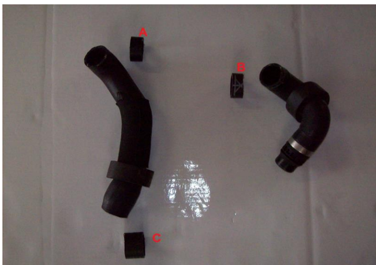
Nebenstehend abgebildete Kühlmittelschläuche kürzen; A & B = 15mm, C = 25mm.