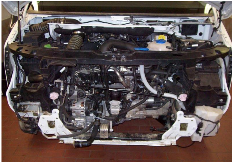
Fahrzeugfront wie auf nebenstehendem Bild gezeigt demontieren ( unbedingt Herstellervorgaben ( ELSA ) und Sicherheitsrichtlinien beachten ).