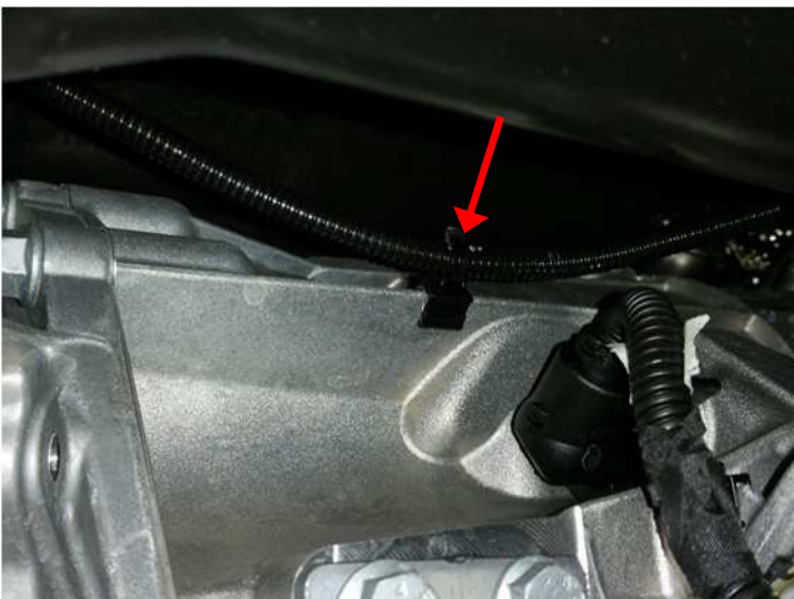
Am Getriebe entlang.