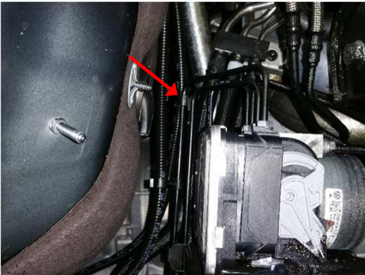
Vorbei an der ABS Einheit.