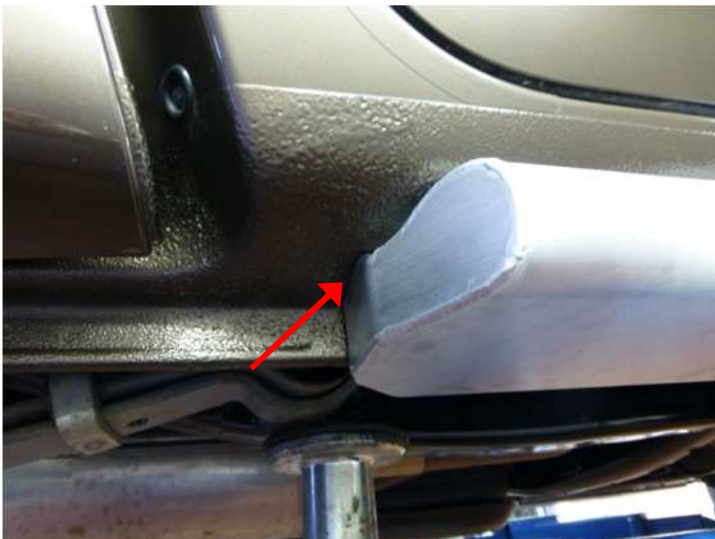
Einbaulage hinten, Rockslider an Sicke im Schweller ausrichten.