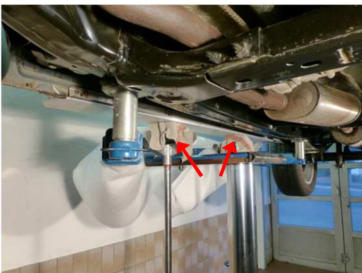
Rockslider mit beiden Getriebehebern an die Karosserie anpressen.